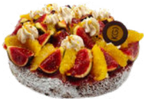
TARTE AUX FRUITS DE SAISON 7,10€ ÉTÉ

crème aux œufs, chantilly, fruits de saison et coulis (fruits rouges, caramel, Grand marnier)