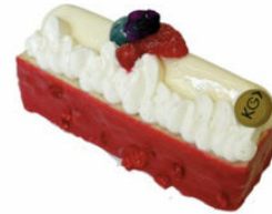
PINK FLAMINGO 7,50€ ÉTÉ