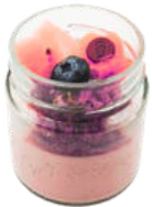
VERRINE KINARI FRUITS ROUGES 5,90€ ÉTÉ

génoise matcha, crème chantilly vanille, fraises fraîches, compotée de fraises au citron vert, haricots rouges..