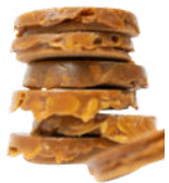
FLORENTINS AUX AMANDES 10€ vendus par 9