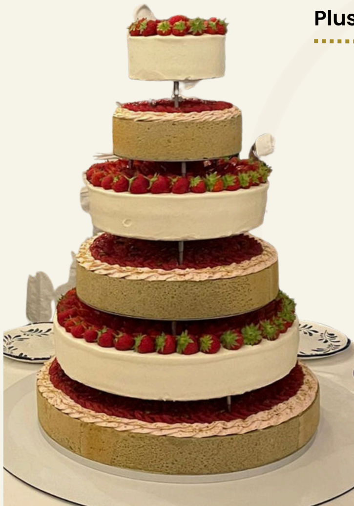
"OR VERT" à étages

Demande sur devis : info@lapatisserie-kg.com