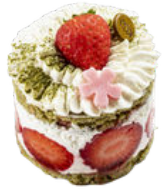
KO MATCHA 7,50€ ÉTÉ

génoise matcha, crème chantilly vanille, fraises fraîches, compotée de fraises au citron vert, haricots rouges..