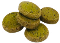
DIAMANTS MATCHA 8,50€ vendus par 16