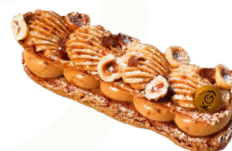
ÉCLAIR PARIS-BREST 7,50€ HIVER

croustillant café, biscuit noisette, punch café, crème noisette, mousse et crémeux café.