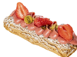
ÉCLAIR FRAISE - PISTACHE 7,10€ ÉTÉ

biscuit noisette, croustillant noisette, crémeux caramel, compotée de poire Williams, crémeux vanille, glaçage Dulcey.