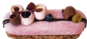
HANABI 7,80€ ÉTÉ

génoise matcha, crème chantilly vanille, fraises fraîches, compotée de fraises au citron vert, haricots rouges..