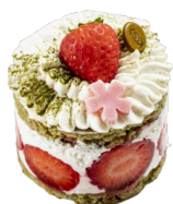
KO MATCHA 7,30€ ÉTÉ

génoise matcha, crème chantilly vanille, fraises fraîches, compotée de fraises au citron vert, haricots rouges..