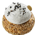
MINI CHOUX PLEINE LUNE 3,50€