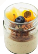
VERRINE KINARI 5,90€ ÉTÉ / HIVER

pâte à choux, crème mousseline au praliné noisette maison, amandes effilées, noisettes concassées.