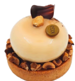
WILLIAMS 7,30€ HIVER