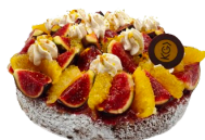
TARTE AUX FRUITS DE SAISON 7.10€ ÉTÉ /HIVER - NOUS CONTACTER

croustillant chocolat cranberry, crémeux chocolat, biscuit moelleux chocolat, crémeux vanille, confit cassis, mousse cassis, chantilly cassis, glaçage chocolat.