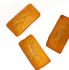
FINANCIER AMANDE 1,20€