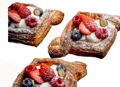
COUSSIN AUX FRUITS DE SAISON 2€