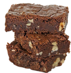
BROWNIE NOIX DE MACADEMIA 1€