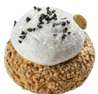
CHOUX PLEINE LUNE 3€