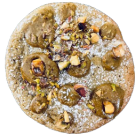
COOKIE PISTACHE / MATCHA / CHOC BLANC 2€