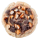
COOKIE CHOCOLAT LAIT / CACAHUÈTE 2€